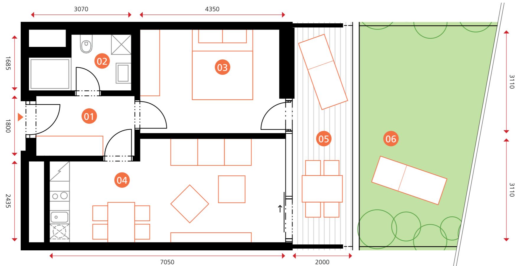
zákes jednotky včetně zahrady:

objekt A1A2 • 1NP • byt A1.1.10 • 2+kk • 109,2 m 2